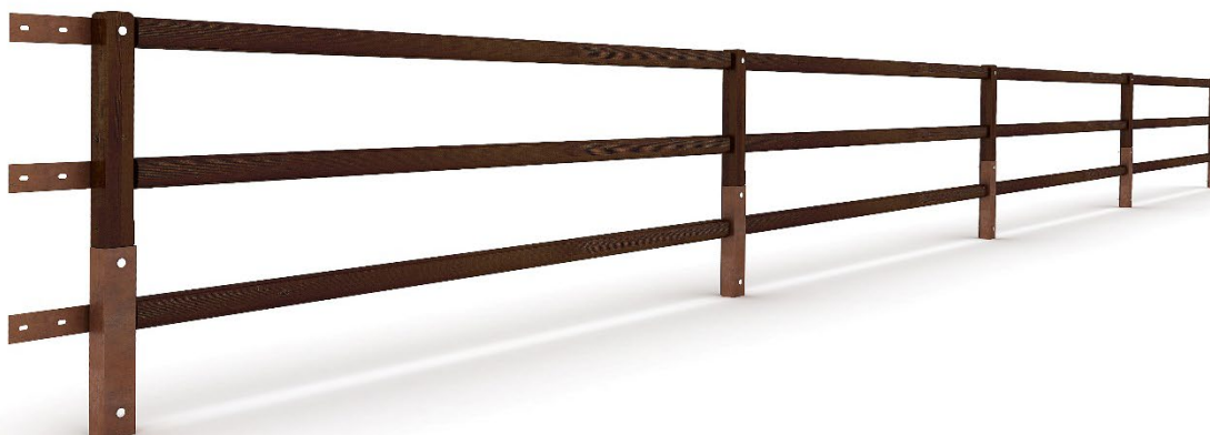
Figura 4. Versione a tre correnti - trattamento superficiale colore noce scuro

NB: La protezione BPC-02 non è normalmente disponibile presso il nostro stabilimento, in quanto viene prodotta solo su ordinazione e per quantitativi minimi superiori ai 300 metri.