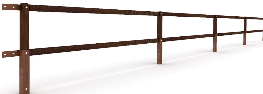
Figura 2. Versione a due correnti - trattamento superficiale colore noce scuro