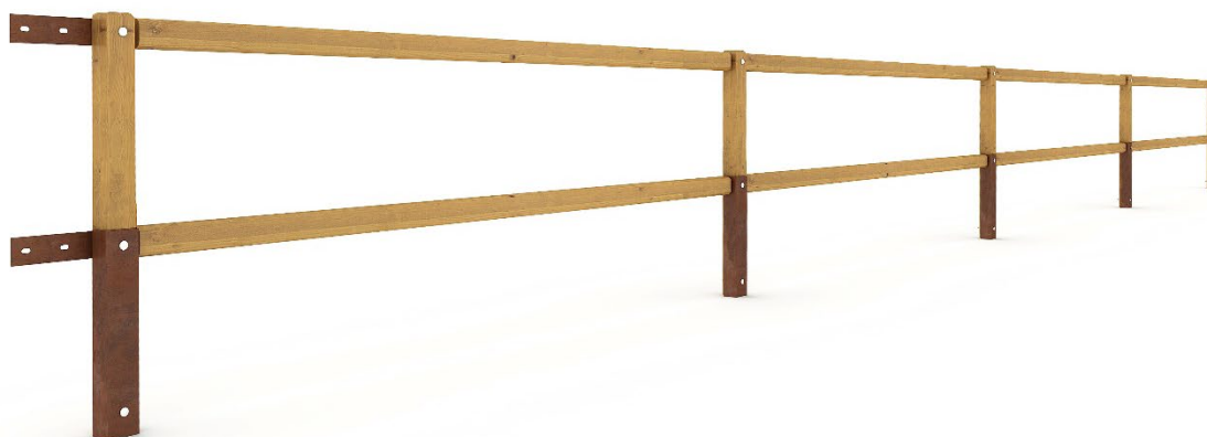
Figura 1. Versione a due correnti - trattamento superficiale trasparente, colore naturale