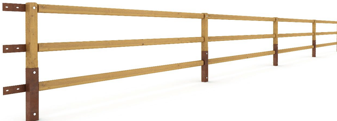
Figura 3. Versione a tre correnti - trattamento superficiale trasparente, colore naturale